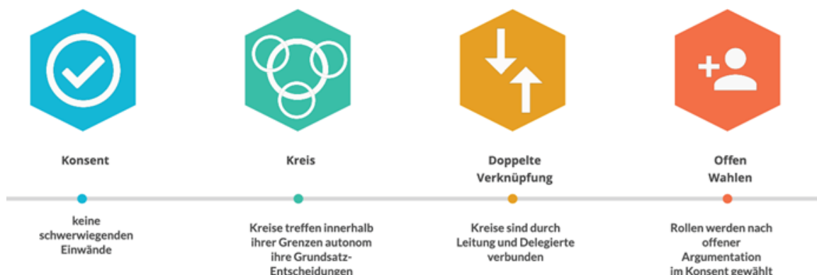
Die 4 soziokratischen Basis-Prinzipien